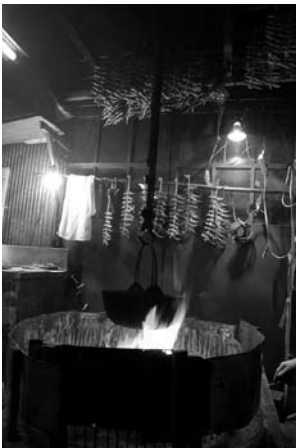
▲ ③天井につるし、いぶす