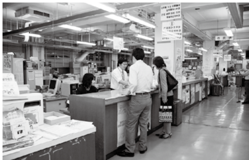
▲ 市民課窓口延長の様子