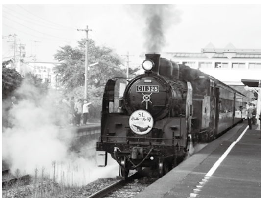
▲ 昨年のプレDC SLホエール号