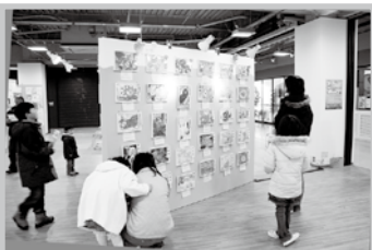
展示会のイメージ