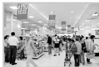
買い物スペース「エスタ」