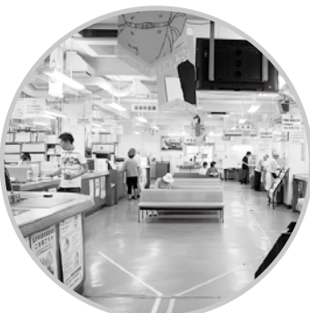
現在の市民課窓口の様子