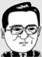
石巻市長 土井喜美夫