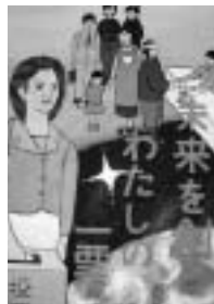
安海絵里加さんの作品