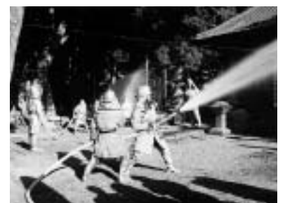
▲ 昨年の防火訓練(真野 長谷寺)

昭和24年1月26日に法隆寺金堂壁画が火災により焼失したことをきっかけとして、この日を『文化財防火デー』と定め、文化財を火災や震災、その他の災害から守るために、全国的に防火運動を展開しています。