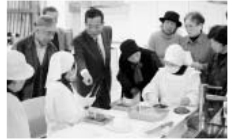
▲ 前回の「おでかけ市長室」からし巻き作り実演見学