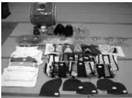
▲ 後谷地法印神楽保存会

後谷地法印神楽保存会は、文化的価値の高い歴史ある神楽の伝承と後継者育成に力を入れており、そのために必要な備品を整備しました。