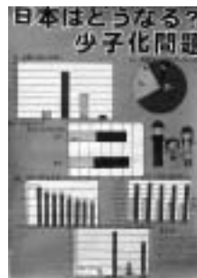
第3部 市長賞 「日本はどうなる? 少子化問題」