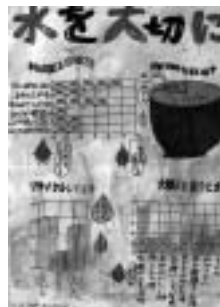
第2部 市長賞 「水を大切に」