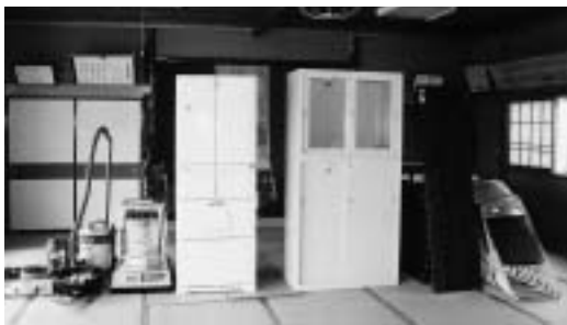
▲今回整備された備品により、地域のふれあいとコミュニティ活動の推進が期待されます。