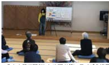
▲みなと荘で開催した出張お笑いライブの様子