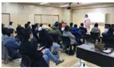
▲満員御礼の出張お笑いライブの様子