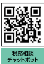
税務相談チャットボット