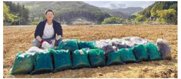
▲畑にまく有機肥料