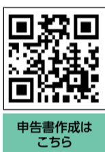
申告書作成はこちら