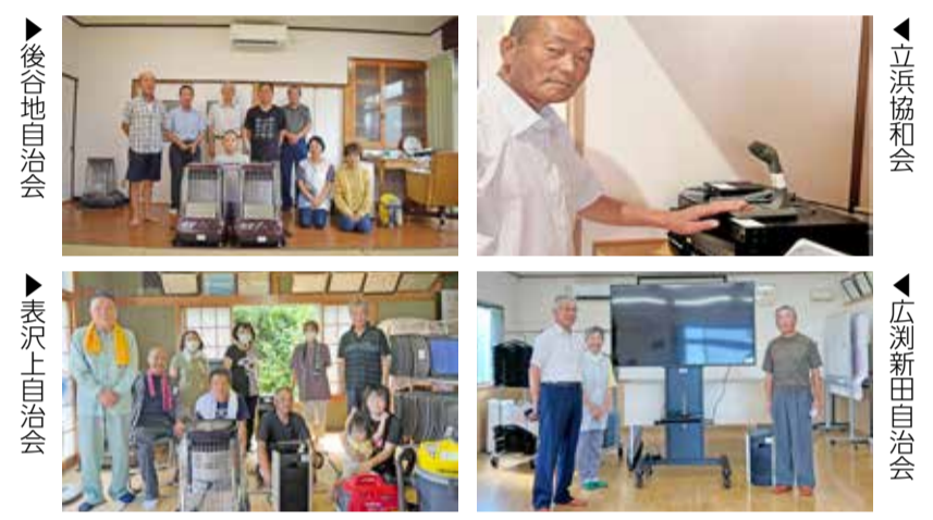
申・問 地域協働課(内線3315)・各総合支所地域振興課