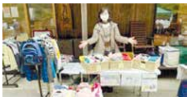
▲活動の様子(地域のイベントにお下がり洋服シェアコーナー出店)