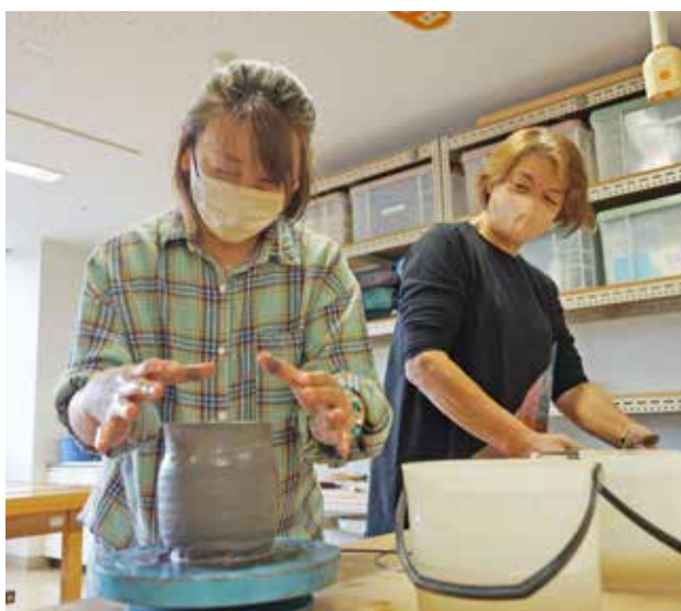
ろくろを回転させ、形を整えます

て高さを出します。焼いた時にひび割れないようにしっかりと隙間を埋め、なでるように表面をならしていきます。