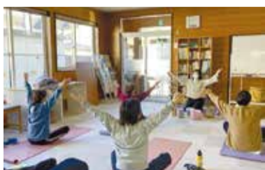
▲活動の様子(定期開催のリラックスヨガ)