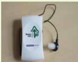
▲ヒアリンググループ

☎ 石巻ささえあいセンター総合受付 (午前9時～午後5時) ☎ 0225-25-6099 保健福祉総務課(内線2466)