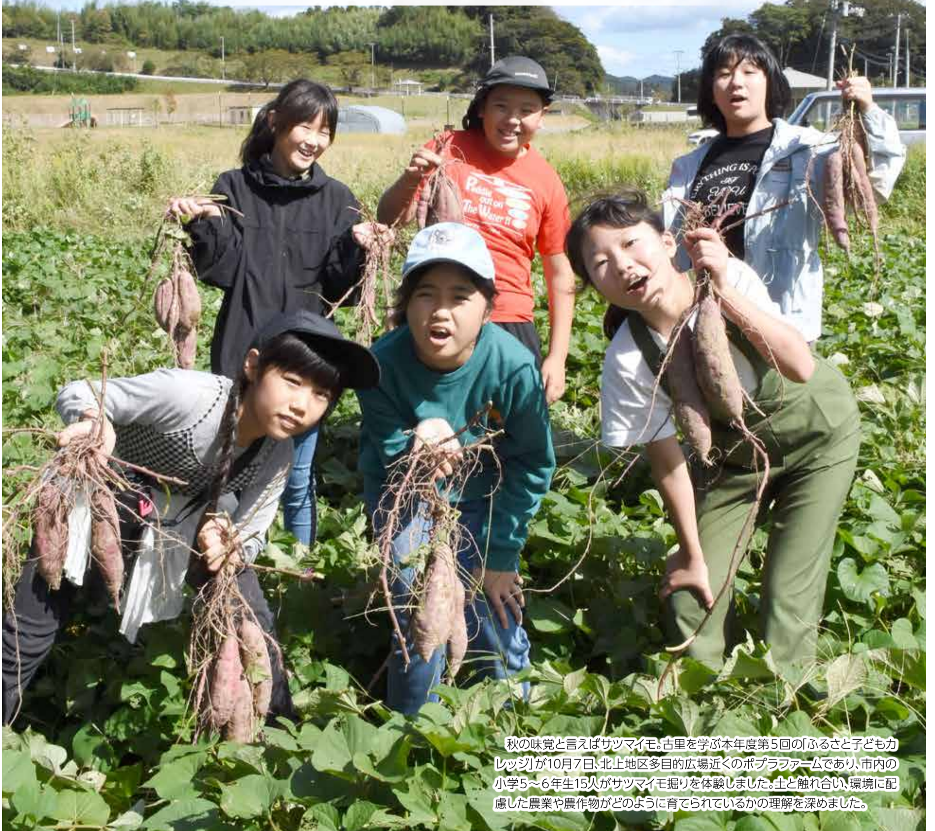
秋の味覚と言えばサツマイモ。古里を学ぶ本年度第5回の「ふるさと子どもレッジ」が10月7日、北上地区多目的広場近くのポプラファームであり、市内の小学5～6年生15人がサツマイモ掘りを体験しました。土と触れ合い、環境に配慮した農業や農作物がどのように育てられているかの理解を深めました。