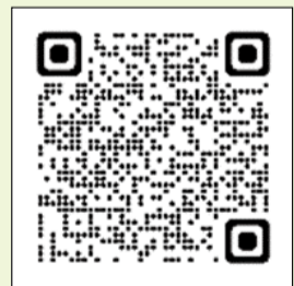
ささえあいセンター ホームページ