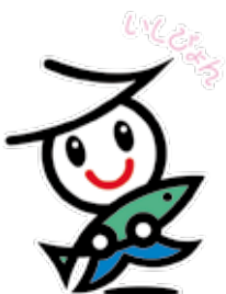
石巻市イメージキャラクター

石巻市中心部の北上川河口部で整備が進められてきた堤防が完成し、国土交通省東北地方整備局と市は4月23日、マルホンまきあーとテラスに関係者を招いて記念の式典を開きました。