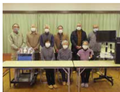
石巻市表沢田町内会