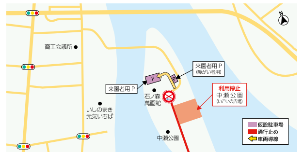
図 基盤整備課(内線5515・5519)