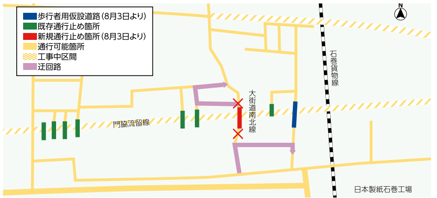
図 宮城県東部土木事務所 ☎94-8763 市道路第1課(内線5658)

とき 8月3日(火)～令和4年3月31日(予定) ところ 大街道東三丁目地内 市道大街道南北線