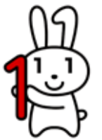
申・問 市民課(内線2313)

マイナンバーカードはマイナンバーの確認書類および身分証明書として利用できるほか、コンビニで各種証明書の取得、インターネットで確定申告などができます。今後さらに利用できるサービスが拡大する予定ですので、ぜひ作ってみてはいかがでしょうか。市民課ではマイナンバーカード申請のお手伝いをしています。電話で申し込みください。