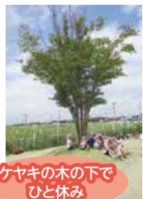
ケヤキの木の下でひと休み