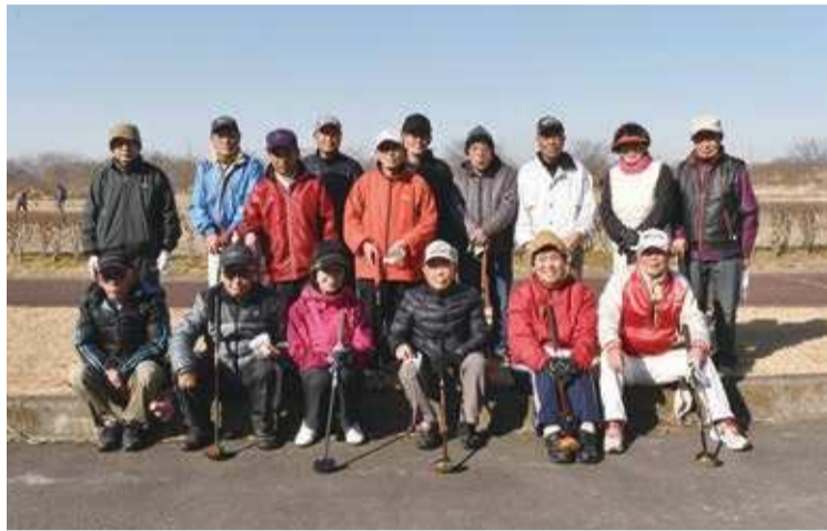
協会の運営を支える役員の方