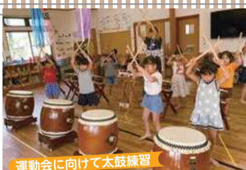
運動会に向けて太鼓練習