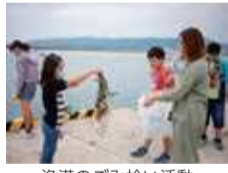
漁港のごみ拾い活動

海は「生命の源」です。しかし今、人間の経済活動が海を大きく変えようとしています。大きな問題の一つに、人間が出す大量のごみや排水があります。海の生き物たちの命を脅かすプラスチックごみ(プラごみ)の量は年々増え、2050年には海に流れ着いたプラごみが海全体の魚の量を超えるという予想もあるほどです。