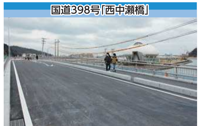
図 都市計画課(内線5624)