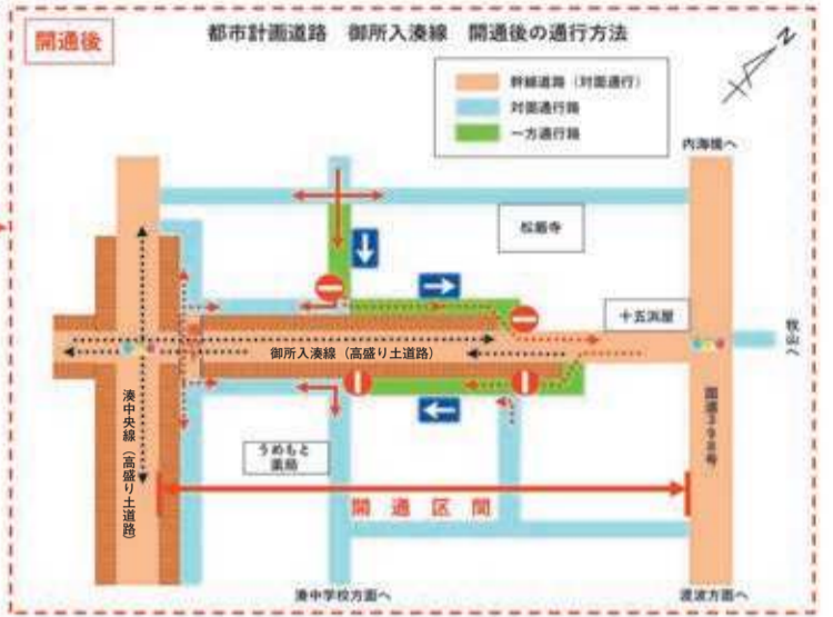
都市計画道路「御所入湊線」位置図