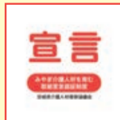
【宣言事業所マーク】