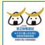
【第2段階認証事業所マーク】

みやぎ介護人材を育む 取組宣言認証制度事務局 ☎ 022-343-8565 県長寿社会政策課 ☎ 022-211-2556