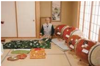
長面伝承太鼓保存会

※宝くじ助成を希望する団体は、問い合わせください。 ☒ 地域協働課(内線4239)・各総合支所地域振興課