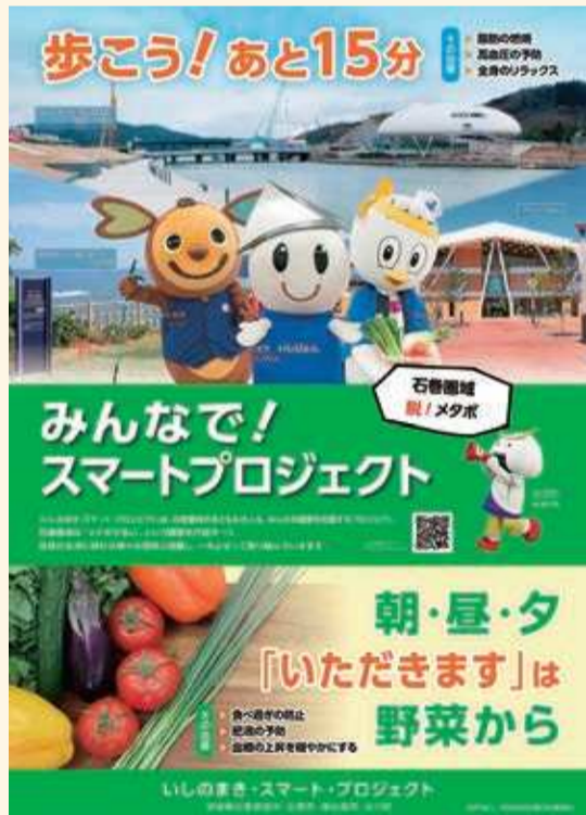
問 県東部保健福祉事務所 健康づくり支援班 ☎94-6124

11月はみやぎ食育推進月間です。石巻地域の旬の野菜で、おいしくベジファーストを実践しましょう♪