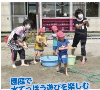
園庭で水てっぽう遊びを楽しむ

昭和56年4月に開園し4・5歳児16人が伸び伸びと楽しく活動しています。田園に囲まれた自然豊かな環境を生かした野菜作りや散歩などのさまざまな体験行事があり、隣接する稲井小学校、稲井中学校の児童、生徒との交流活動も盛んです。