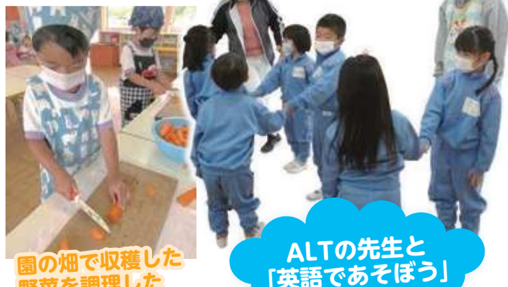
園の畑で収穫した野菜を調理した「カレー会」