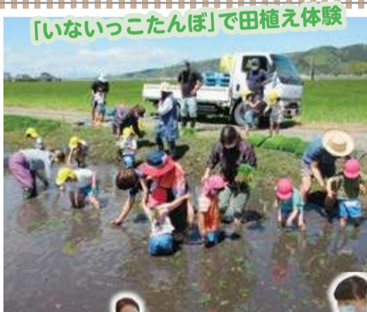
「いないっこたんぼ」で田植え体験