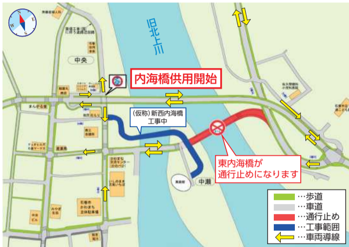
図 県東部土木事務所 ☎94-8763