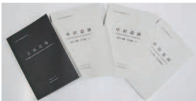
中沢遺跡、立浜貝塚の発掘調査報告書

「ウェブサイト」全国遺跡総覧では、簡単にダウンロードして閲覧することができますので、ご希望の方はご利用ください。