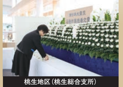
桃生地区(桃生総合支所)