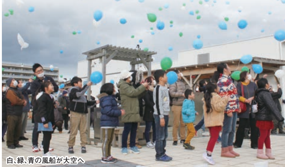
白、緑、青の風船が大空へ