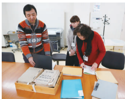
資料整理作業の様子