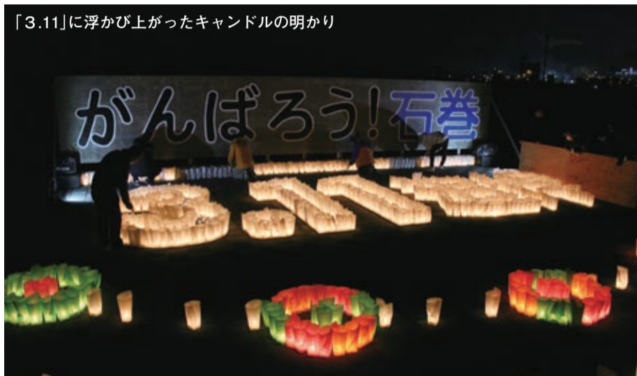
「3.11」に浮かび上がったキャンドルの明かり