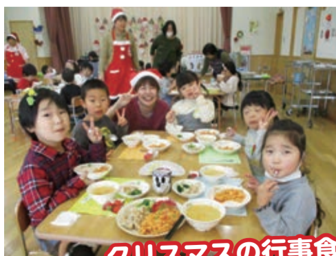
クリスマスの行事食をおいしく味わう