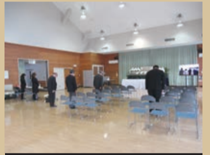
北上地区(北上保健医療センター)