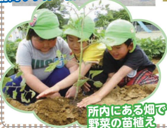
所内にある畑で野菜の苗植え