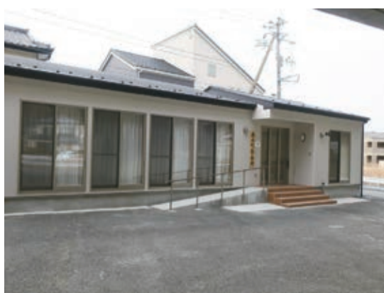
図 地域協働課(内線4232)