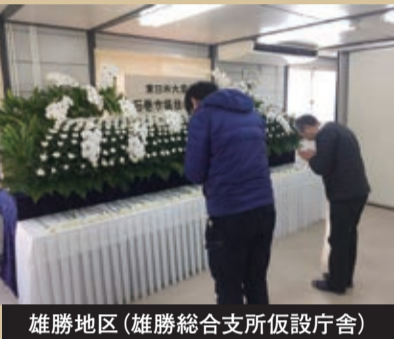
雄勝地区(雄勝総合支所仮設庁舎)