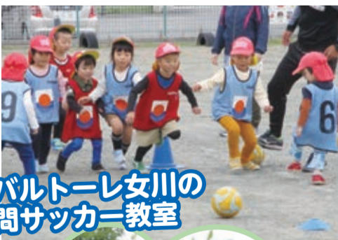
コバルト・レ女川の訪問サッカー教室

県立旭山公園の麓に位置し、緑に囲まれた自然豊かな環境の中で、1歳児から5歳児までの子どもたちが楽しく過ごしています。近くには北村小学校や老人ホームがあり、交流も盛んです。平成17年から保育所、幼稚園に通っていない幼児も預かる「一時保育事業」を行っています。