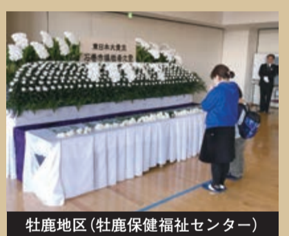
牡鹿地区(牡鹿保健福祉センター)