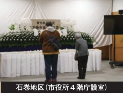
石巻地区(市役所4階庁議室)

どったキャンドルをともし、亡くなった人たちの冥福を静かに祈りました。また、市の追悼式が行われた河北地区以外の石巻、雄勝、河南、桃生、北上、牡鹿の各地区では市役所、総合支所などに祭壇と献花台が置かれ、地区住民らが次々と献花に訪れ、祈りをささげました。