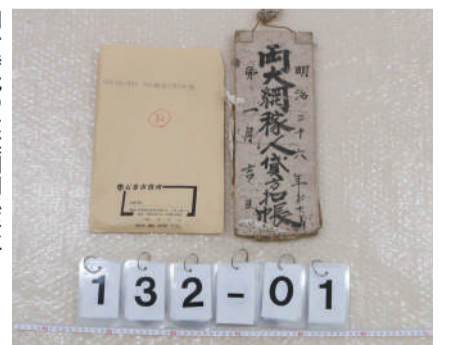
明治時代の大謀網関係資料