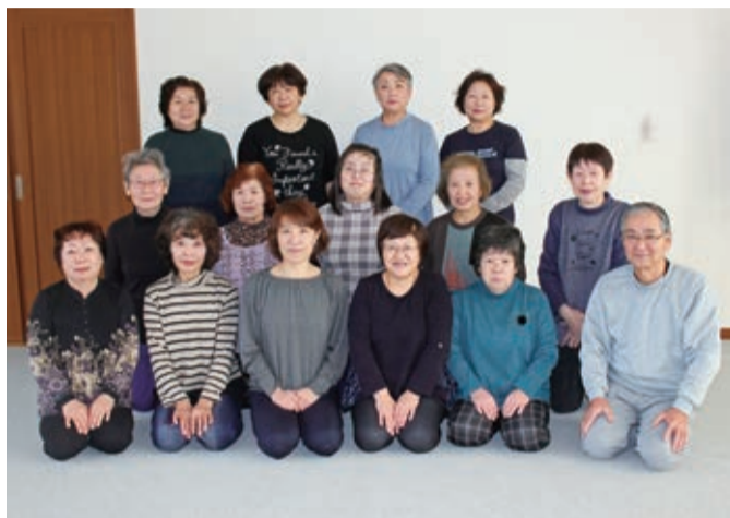
笑顔でヨガを習う会員

教室では、ストレッチで入念に筋肉や関節をほぐした後、段階に応じてさまざまなポーズを習い、心地よい汗を流します。会員は、その日に習ったことを自宅に帰って反復し、地道に練習を続けています。