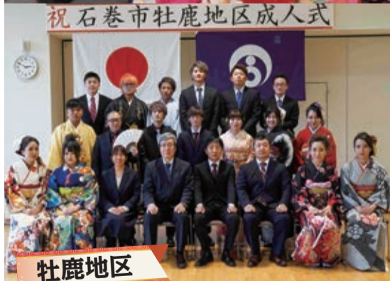
祝 石巻市牡鹿地区成人式