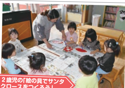
2歳児の「絵の具でサンタクロースをつくろう」