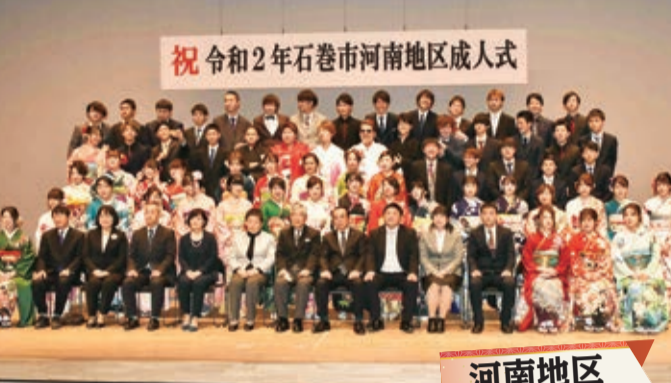
祝 令和2年石巻市河南地区成人式