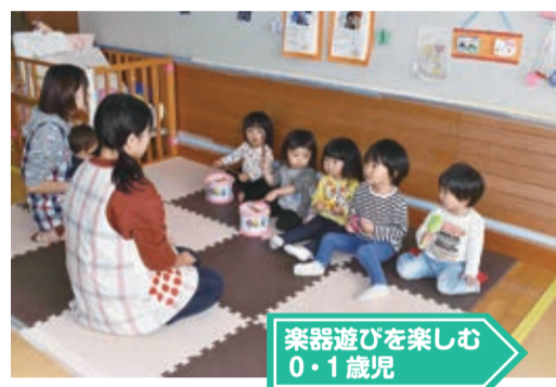
楽器遊びを楽しむ0・1歳児