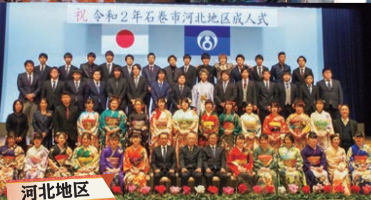
祝 令和2年石巻市河北地区成人式