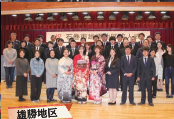
祝 石巻市雄勝地区成人式