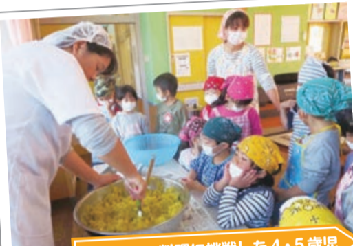
サツマイモ料理に挑戦した4・5歳児