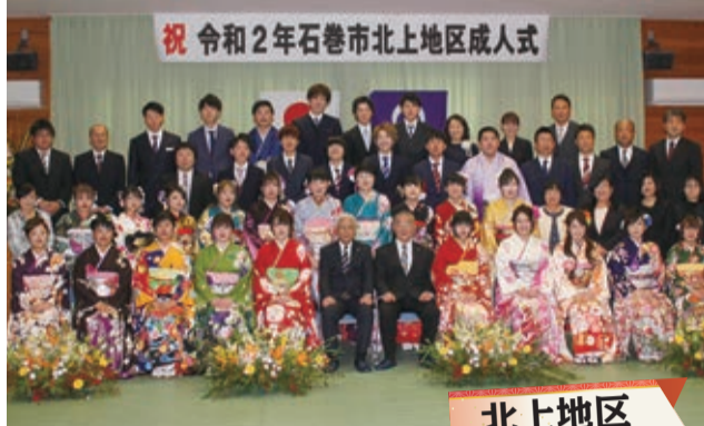
祝 令和2年石巻市北上地区成人式