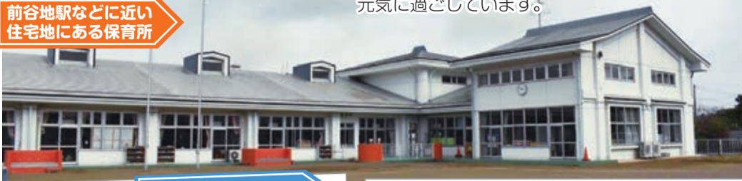
マラソンで体づくり

前谷地駅や河南総合支所などに近い住宅地にあり、そばを通る国道108号の南側には田園地帯が広がります。静かで自然に恵まれた保育環境の中で、0歳児から5歳までの53人が仲良く元気に過ごしています。