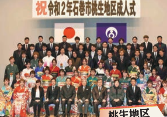
祝 令和2年石巻市桃生地区成人式