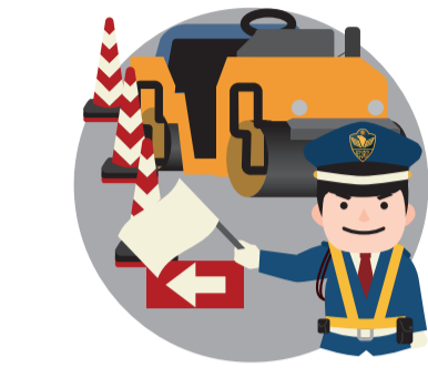
図 県東部土木事務所 道路建設第一班 ☎94-8763 市区画整理課(内線5583)