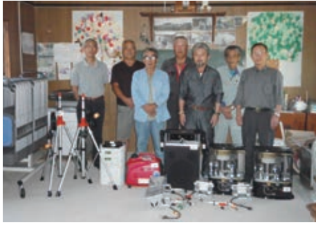
一心館運営委員会