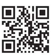
最高裁 ホームページ

令和2年の裁判員候補者 裁判員制度の名簿記載通知を送付します 名簿に登録された方へ、11月中旬に名簿に登録されたことの通知(名簿記載通知)を送付します。この通知は、令和2年2月ごろから約1年間に裁判員に選ばれる可能性のあることをお伝えし、心づもりをしていただくためのものです。 詳しくはホームページをご覧ください。 ☎ 仙台地方裁判所事務局 総務課広報係 022-222-6115 市総務課(内線4036)