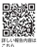
図 地域振興課(内線4245)