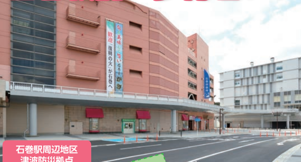
石巻駅周辺地区 津波防災拠点 歩行者デッキ位置図