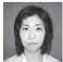
市立病院 主任栄養士