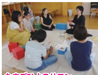
たまごひよこサロン

自由開放…月曜～土曜(日曜・祝日を除く)午前9時30分～午後4時30分まで利用可能です。 午後は、電話予約で自由に遊べます。子どもたちを遊ばせながらママ友トークしてもOK! 支援センター職員に疑問や相談をしてもらってOK! 気軽にご利用ください。