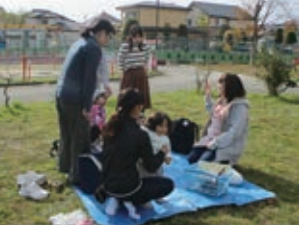
子育てふれあいサロン～人形劇～

主任児童委員の方が来園し、一緒に遊んでくれます!! 人形劇など楽しいイベントもあります♪