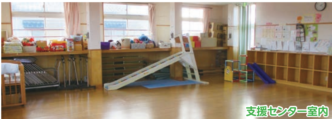
支援センター室内

自由開放…月曜～土曜(日曜・祝日を除く)午前9時30分～午後4時30分まで利用可能です。 午後は、電話予約で自由に遊べます。子どもたちを遊ばせながらママ友トークしてもOK! 支援センター職員に疑問や相談をしてもらってOK! 気軽にご利用ください。