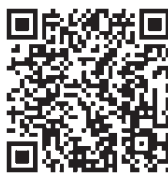
【地域スタッフ(有償)】