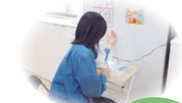
親子の健康もサポート