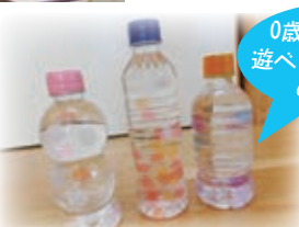
0歳から転がして遊べるペットボトルのおもちゃ