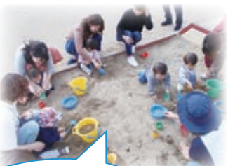
よちよち・はいはい 砂場あそび