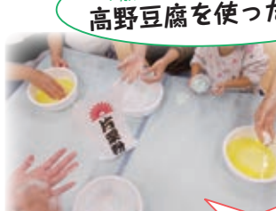
1歳6カ月~2歳6カ月 高野豆腐を使ったあそび