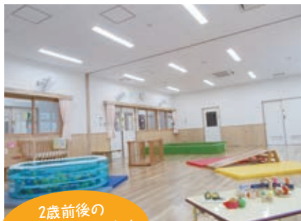
2歳前後の子ども達が大好きなおままごと