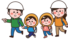
圖 危機対策課(内線4162)

なお、退避した時点で訓練は終了となります。 ※今回の訓練では、学校施設への避難はできません。