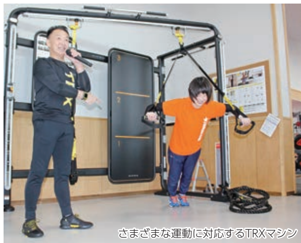
さまざまな運動に対応するTRXマシン