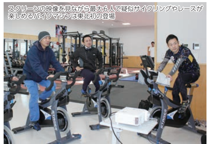
スクリーンの映像を見ながら最大6人で疑似サイクリングやレースが楽しめるバイクマシンは東北初の登場