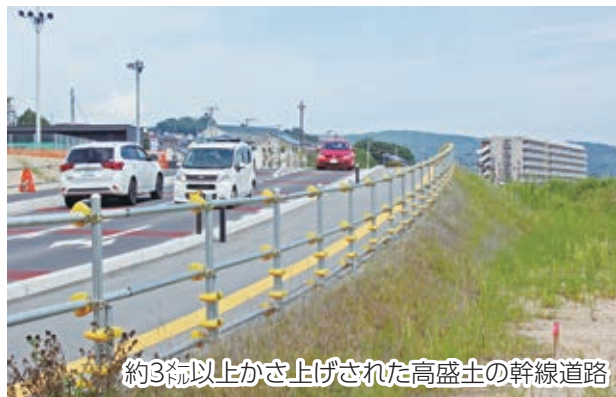
約3㍍以上かさ上げされた高盛土の幹線道路