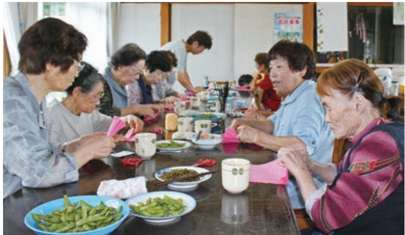
会話が弾む手作業

詞がある「お座敷小唄」のユーモラスな替え歌でスタート。趣味を持つこと、仲間と集うこと、そして何より前向きな気持ちを忘れないことをお互いに確認しています。