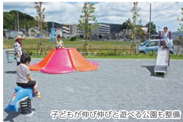
子どもが伸び伸びと遊べる公園も整備