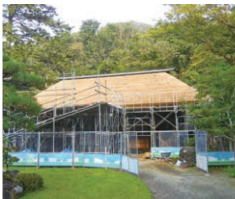
齋藤氏庭園修復工事 木小屋かやふき替え

生涯学習課 林業で効率的に植林と伐採を行うには、非樹林地も設ける必要があります。石巻北上茅場は山中の非樹林地で、この付近は天然記念物に指定されているイヌワシの繁殖地でもあり、茅場はイヌワシの格好の餌場となっています。このように計画的に茅場を整備することは林業や自然保護の面でもメリットがあり、今後茅場の整備を推進していく予定です。