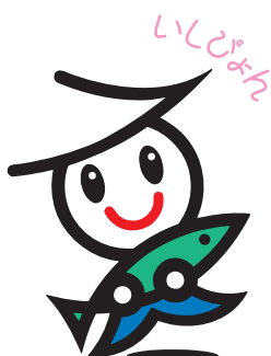
石巻市イメージキャラクター

石巻を音楽のある街にしよう「トリコローレ音楽祭」が8月26日、中瀬公園をメイン会場に市内15カ所で開かれました。ロック、フォーク、ポップス、クラシック、ジャズなどさまざまなジャンルの音楽愛好者約160団体が参加しました。2004年に始まり、震災の年も継続、15回目を迎え過去最大規模の音楽祭となりました。5店舗をはしごする食の祭典「ボンバルいしのまき」も42店が参加し同時開催。音楽とおいしい料理を味わい、大人も子どもも笑顔、笑顔。演奏者と聴衆が楽しい時間を満喫しました。