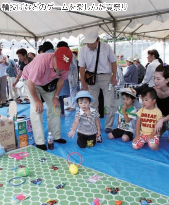
輪投げなどのゲームを楽しんだ夏祭り