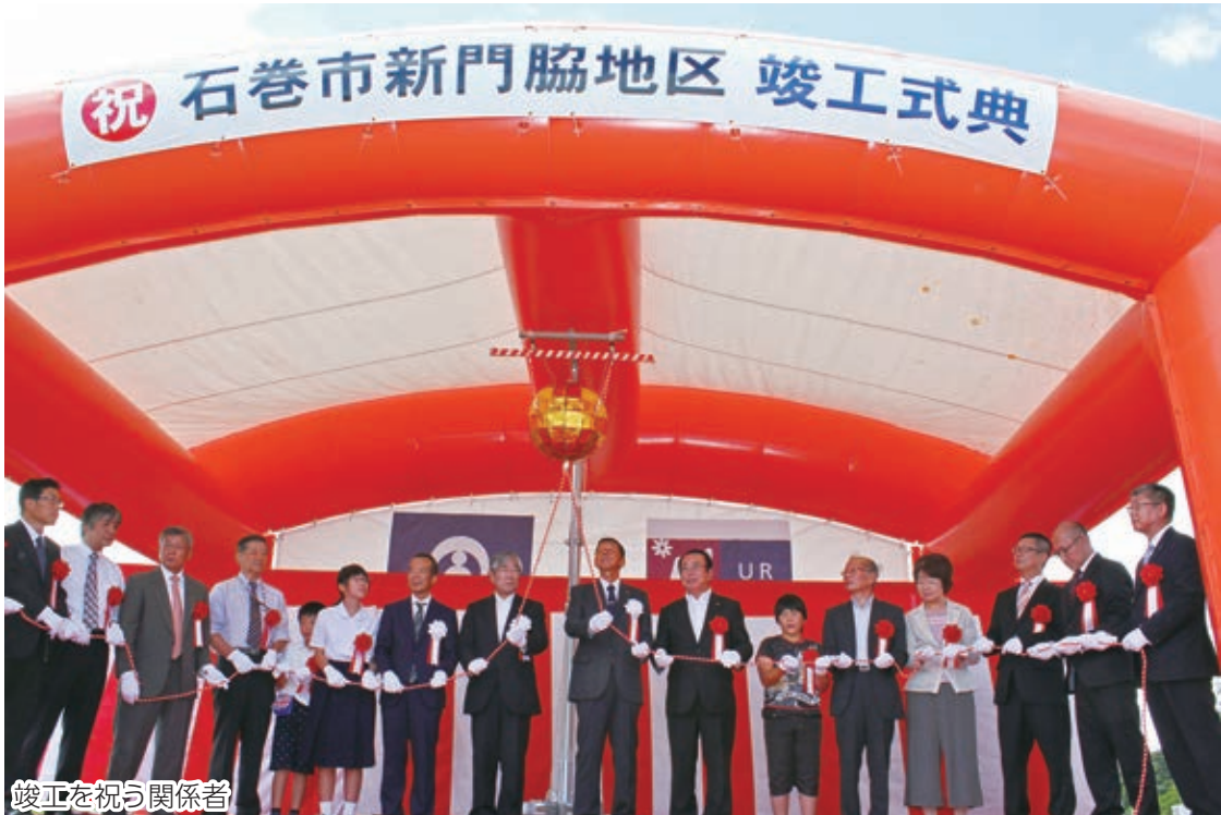
竣工を祝う関係者

事業はURが2014年8月に着工。計画面積23.7㍍、91億円の大規模事業で、防災力の高い街並みを目指し、津波で被災した既成市街地を最大3㍍かさ上げしました。東西に走る高盛土道路の南光湊線の内陸側に宅地や復興公営住宅、3カ所の公園を整備。復興公営住宅は16年10月に門脇東（61戸）、同年12月に門脇西（90戸）で入居が始まりました。