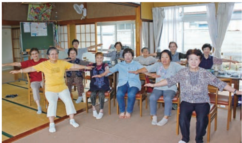
百歳体操でますます元気

現在、メインに行っているのが「いきいき百歳体操」。重りを使うなどした筋力運動で、高齢者が寝たきりや、生活不活発病になら