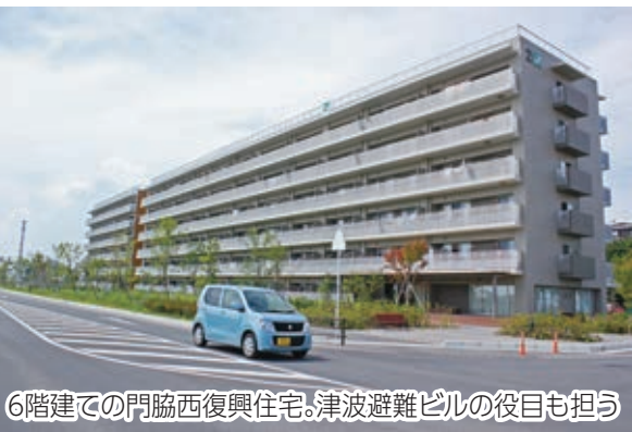
6階建ての門脇西復興住宅。津波避難ビルの役目も担う