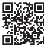
携帯・スマホはこちらから

ぜひ、心の健康維持・増進にお役立てください。 利用料は無料です。ただし、通信料金は自己負担になります。 健康推進課(内線2423)