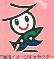
石巻市イメージキャラクター