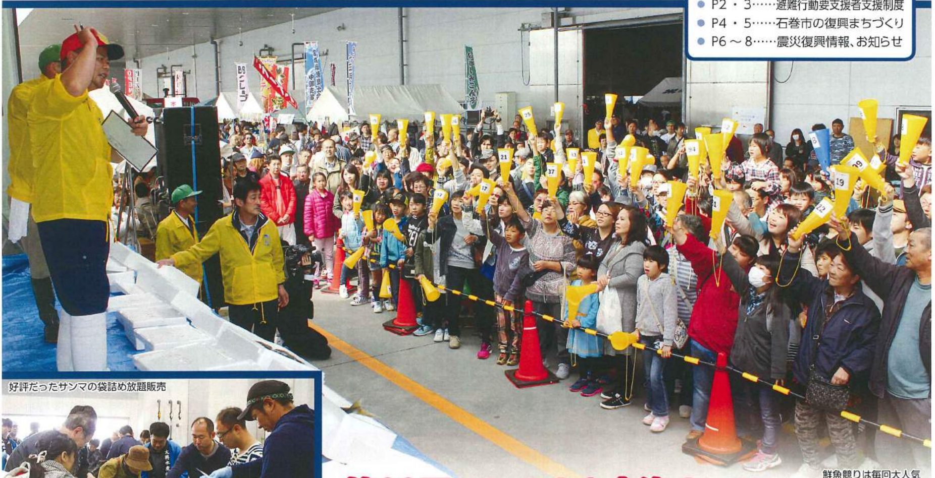
鮮魚競りは毎回大人気