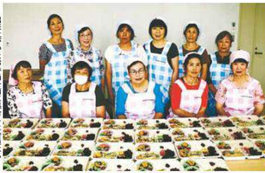
出来上がったお弁当を前に集合した会員たち

作業を始めました。今回は野菜天ぷらを中心とした献立。自宅の畑で育てたカボチャ、しその葉、ササゲや手作りの漬物などを持参し、天ぷらを揚げたり、ご飯を炊いたり、分担して手際よく調理していきま