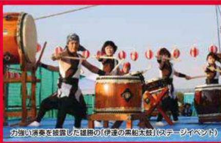
力強い演奏を披露した雄獅の「伊達の黒船太鼓」(ステージイベント)