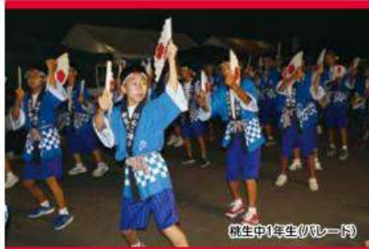
桃生中1年生(リレート)