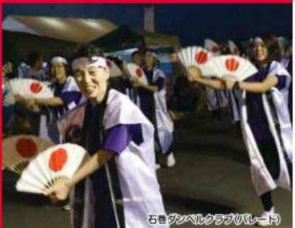
石巻ダンベルクラブ(リレート)