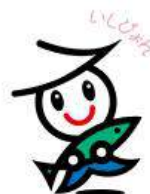
石巻市イメージキャラクター