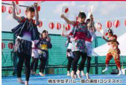
桃生中女子パレード部の演技(コンテスト)