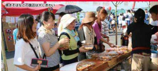
鹿きそほなどの露店は大にざわい