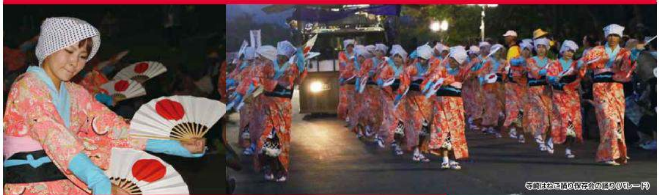
寺崎はねこ踊り保存会の囃り(リレート)