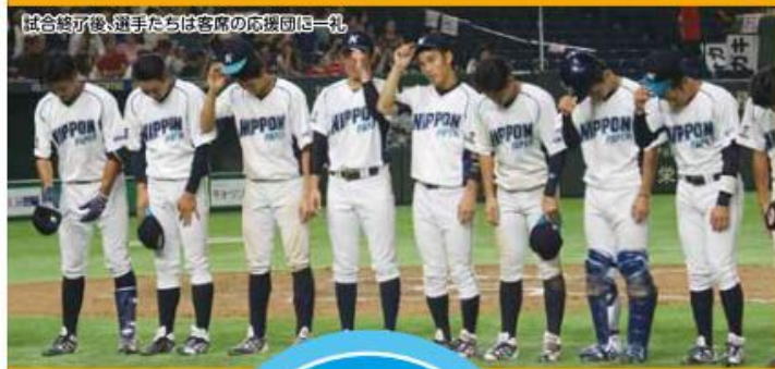
試合終了後、選手たちは客席の応援団に一礼