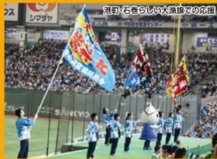
港町・石巻らしい大漁旗での応援