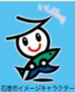
石巻市イメージキャラクター