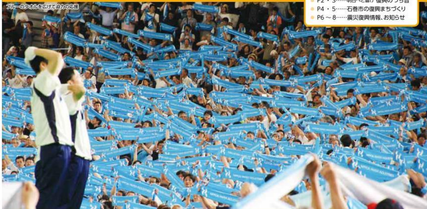
ブルーのタオルを広げて迫力の応援