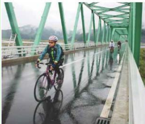
▲昨年9月に開催された「ツール・ド・東北2016」で疾走する参加者

昨年6月10日、「新北上大橋」の車両部の復旧工事が完了し開通式が行われました。また、同年10月には歩道部の工事も完了しました。