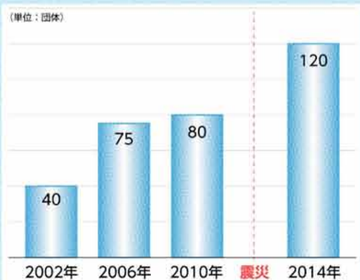
石巻市NPO支援オフィス登録団体数