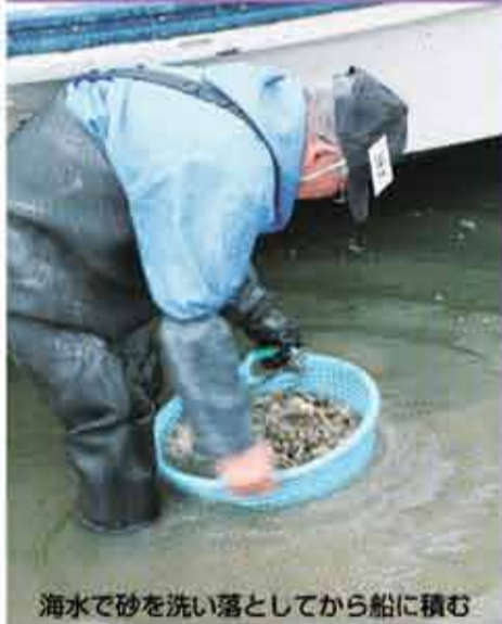
海水で砂を洗い落としてから船に積む