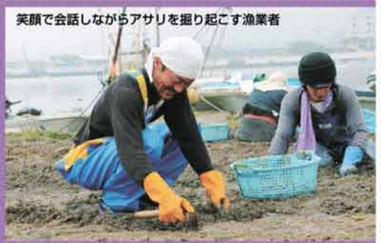
笑顔で会話しながらアサリを掘り起こす漁業者