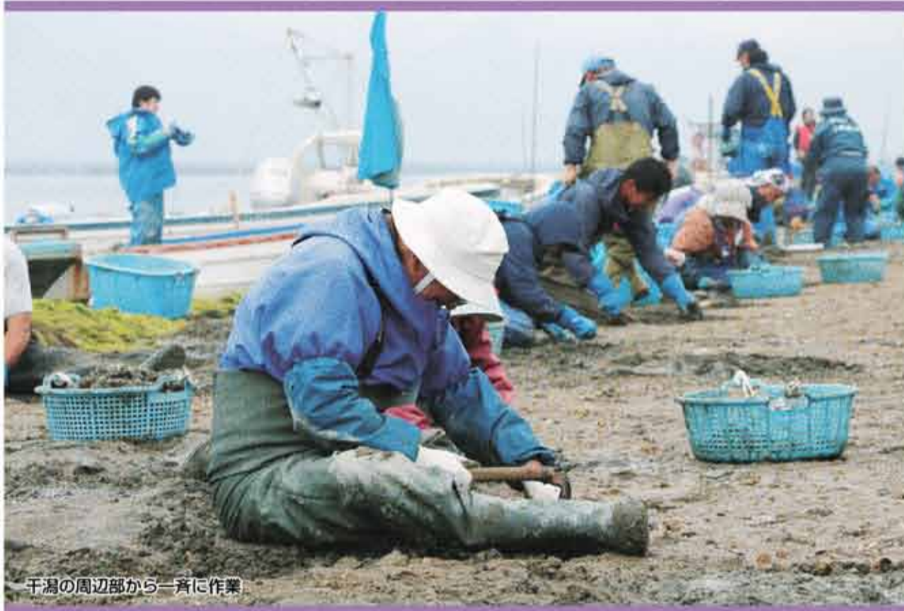
干潟の周辺部から一斉に作業