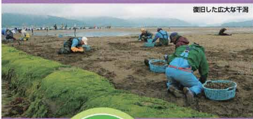
復旧した広大な干潟

万石浦の干潟再生事業は、石巻湾支所分のほか、県漁協石巻地区支所管理分約2.8ヘクタール、同女川支所分約1ヘクタールが平成28年度までに完成しました。石巻湾支所は資源回復のため、万石浦で生き残ったアサリから人工採苗して中間育成、放流してきました。同支所は今回の水揚げ再開を機に、「万石浦産あさり」としてブランド化していく方針です。しかし、大浜の潮干狩り場は復活の見通しは立っていません。