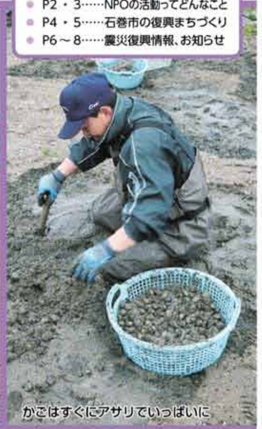
かごはすぐにアサリでいっぱい