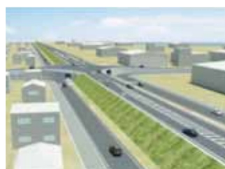
高盛土道路 (完成イメージ)