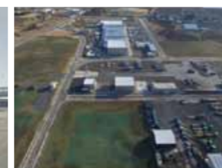
須江地区産業用地