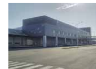
水産物地方卸売市場石巻売場