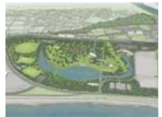
石巻南浜津波復興祈念公園