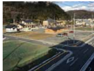
既存市街地の整備