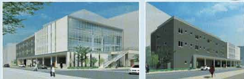
▲完成イメージ (南東側) (南西側)

地域コミュニティで支え合う地域づくりや市民交流の活性化のため、また、医療、保健、福祉の連携強化や介護予防等地域包括ケアの拠点となる施設としての役割を担います。