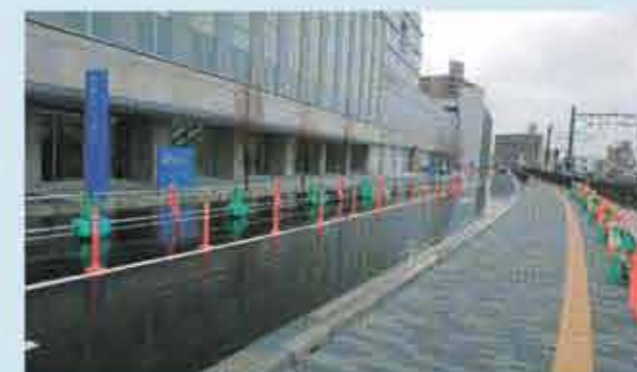
▲完成写真 (病院北側)