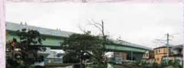
▲七窪蛇田線の完成イメージ

駅西側に国道398号から石巻バイパスまで、JR線路と立体交差する新たな道路を整備します。