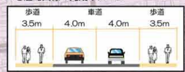
▲七窪蛇田線の道路横断イメージ (橋梁部)