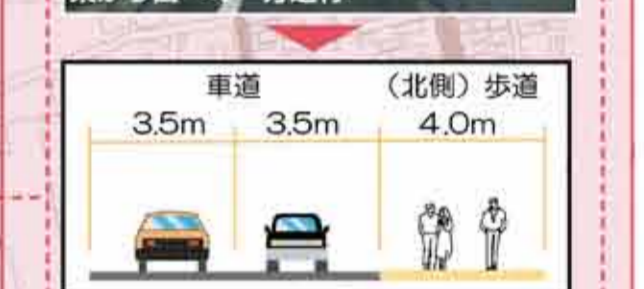
▲東西方向の道路横断イメージ