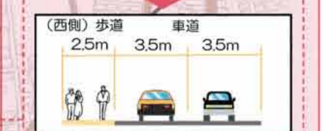
▲南北方向の道路横断イメージ