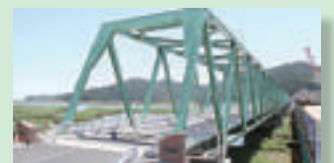
▲新北上大橋復旧 (平成28年6月)