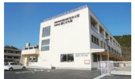
▲みなと荘・湊こども園複合施設開設(平成27年4月)