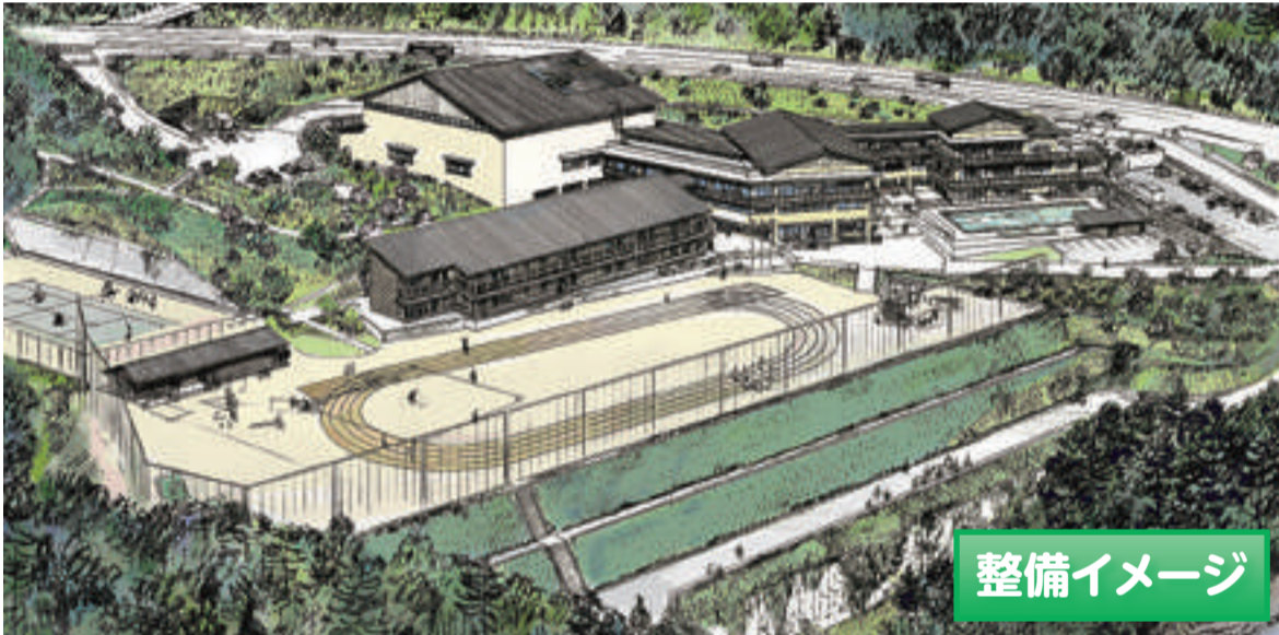
▲雄勝小・中学校(※2学期から新校舎に移転予定)