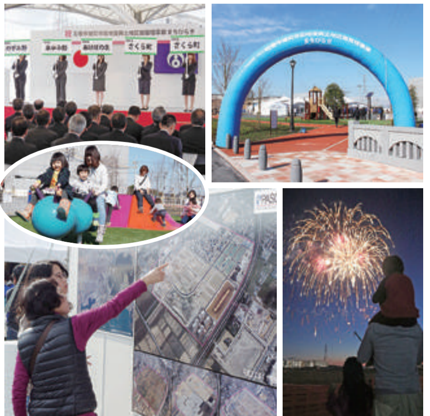
▼新蛇田地区で新市街地6地区のまちびらき開催(平成27年11月)