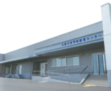
▲東学校給食センター開所(平成28年8月)