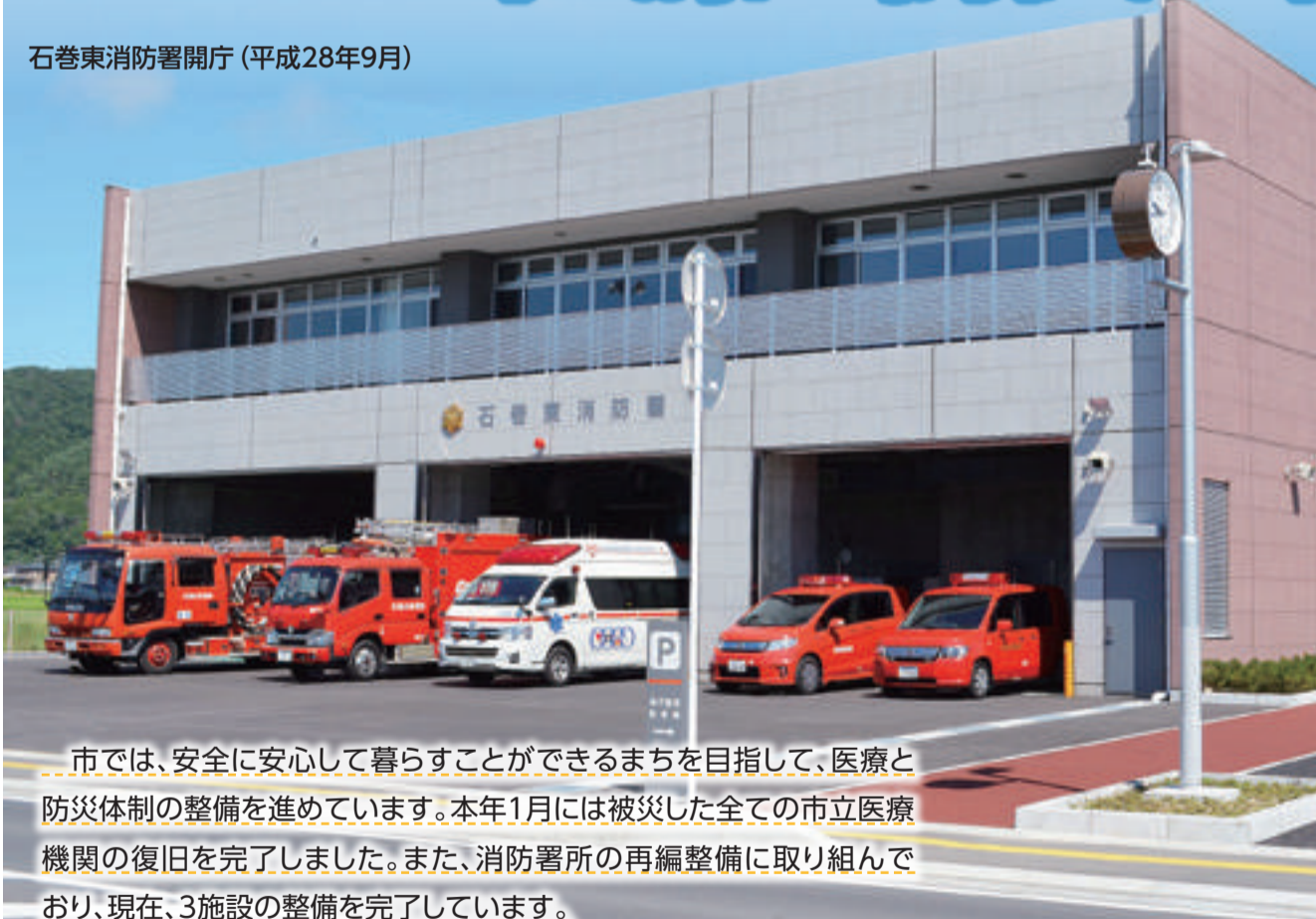
石巻東消防署開庁(平成28年9月)