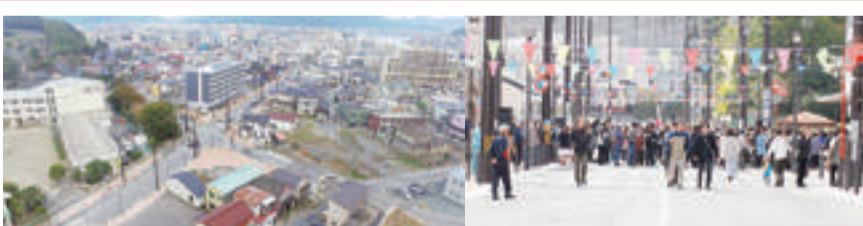
▲中央一まちびらき開催(平成28年10月)