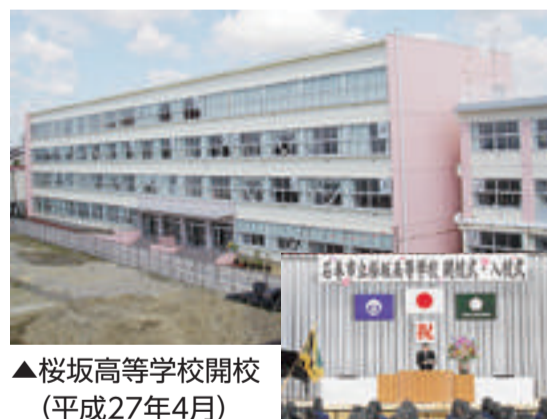
▲桜坂高等学校開校(平成27年4月)