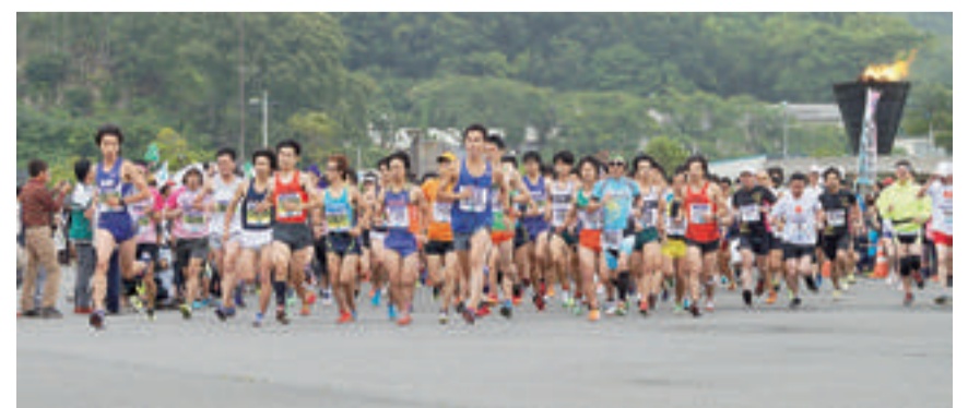
▲第1回復興マラソン開催(平成27年6月)