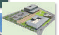
▲北上にっこり地区拠点整備(P3)