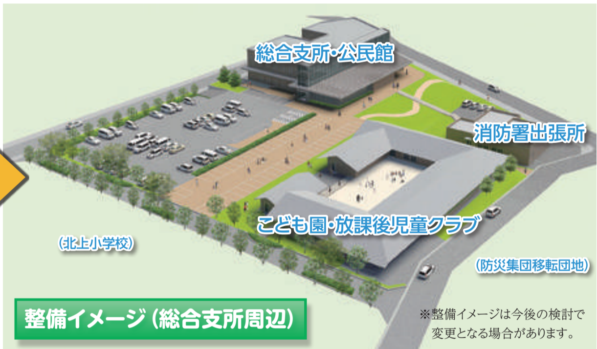
整備イメージ (総合支所周辺)