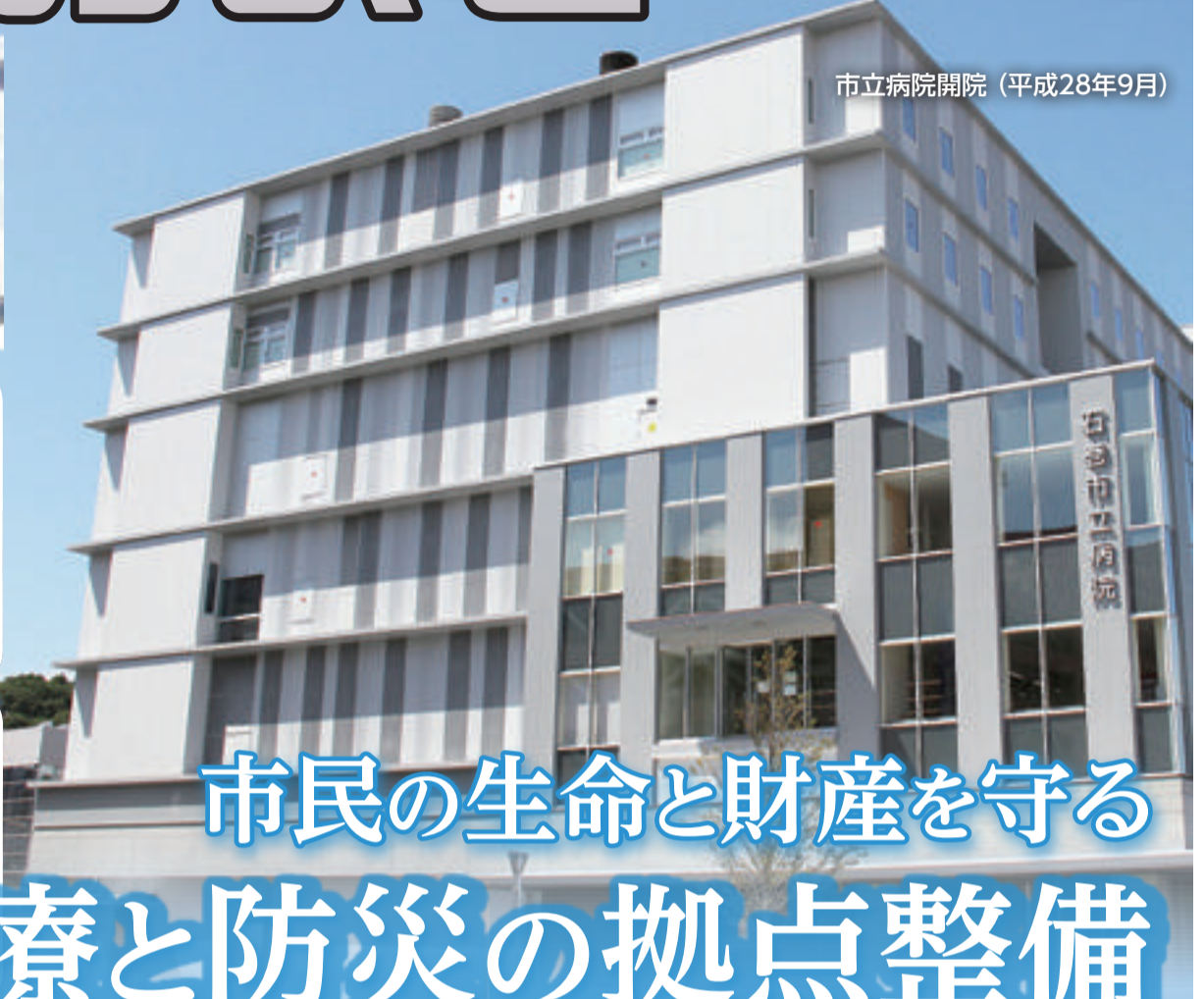
市立病院開院(平成28年9月)