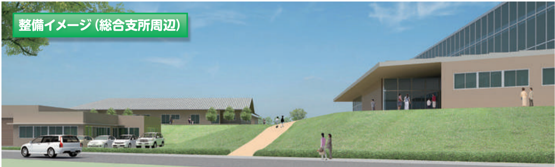
整備イメージ (総合支所周辺)