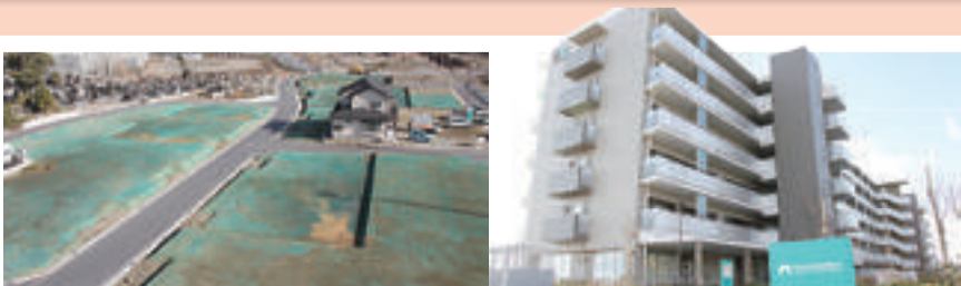
▲かどのわき復興まちびらきイベント開催(平成29年3月)