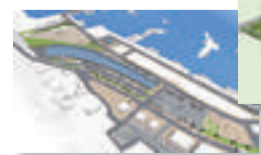
▲鮎川浜地区拠点整備(P4)