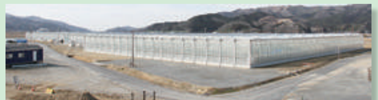
▲次世代施設園芸石巻拠点完成 (平成28年10月)