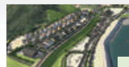
◀雄勝中心部地区拠点整備(P2)

東日本大震災から6年が経過し、市では、復興のさらなる加速に取り組めます。そこで、半島沿岸部の拠点整備等、現在進めている復興まちづくりで目指しているまちの姿等をお知らせします。