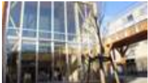
▼子どもセンター「らいつ」開所(平成26年1月)