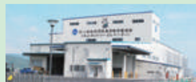
▲北上カントリーエレベーター 供用開始 (平成25年10月)