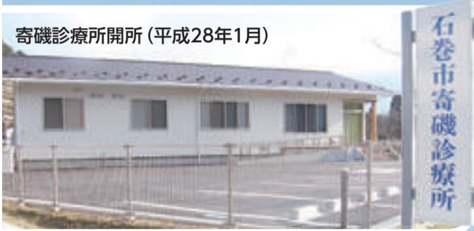
寄磯診療所開所(平成28年1月)