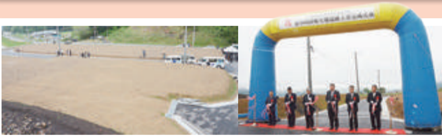
▲半島部防災集団移転団地初の宅地引き渡し(釜谷崎)(平成26年5月)