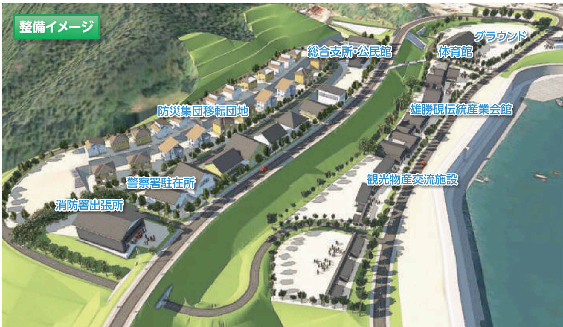
※整備イメージは今後の検討で変更となる場合があります。