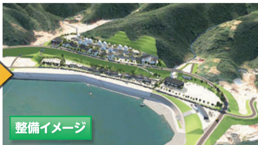
※整備イメージは今後の検討で変更となる場合があります。