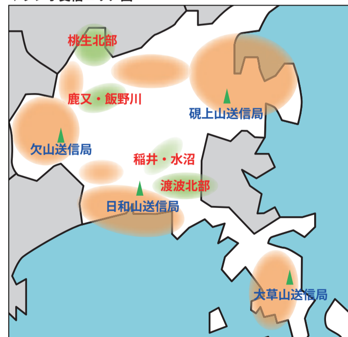
図 危機対策課(内線4164)