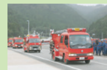
▲消防演習車両隊列行進