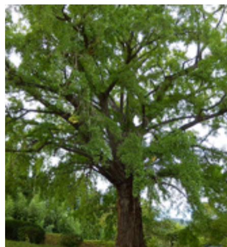
▲龍泉院のイチヨウ

市内第2位のイチヨウは水沼の龍泉院境内にあり、樹齢およそ300年、樹高約25m、幹周約5m、枝張東西約23m南北約26mの巨樹です。