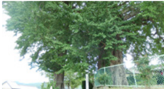
▶吉祥寺のイチヨウ

高木の吉祥寺参道入口に2本のイチヨウが立ち並んでいます。向かって右側は樹高約23m、幹周約6m、枝張東西約27m南北約22mで、樹齢は推定35年とされ、市内第1位を誇る巨樹です。左側は、樹高約28m、幹周約4m、枝張東西約17m南北約18mで、市内第3位の大きさです。