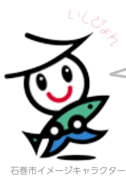
石巻市イメージキャラクター