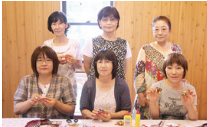
▲お針子サークルのメンバーの皆さん