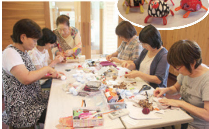
▲皆で作業を進める時間が心の癒やしにつながっています。