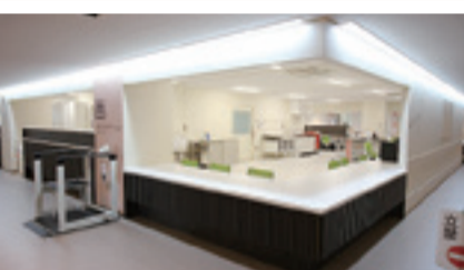
▲スタッフステーション

▲4床室 病室は個室と4床室を備え、4床室は1人あたり8㎡以上の広さを確保したゆとりのある造りになっています。