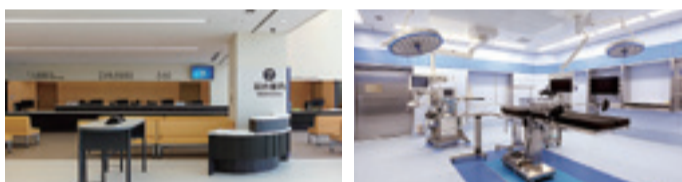
▲総合案内・総合受付 ▲手術室