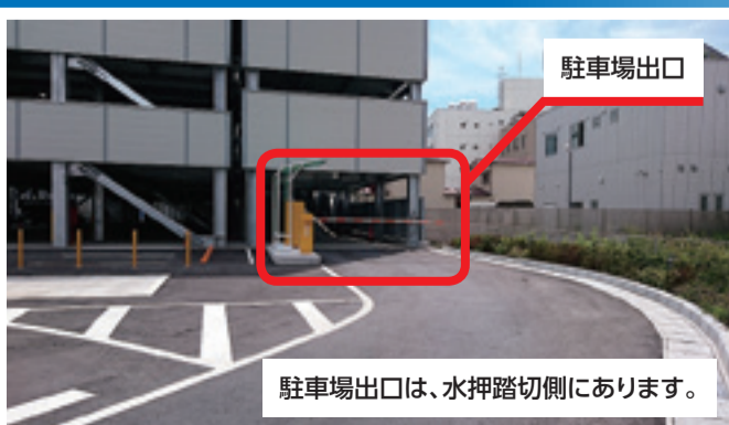
▲駐車場出口は、水押踏切側にあります。