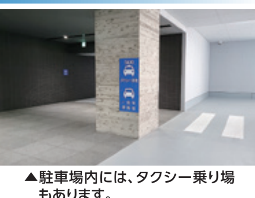
▲駐車場内には、タクシー乗り場もあります。