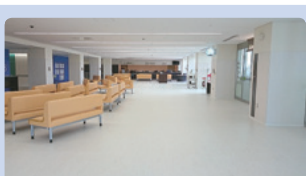
▲2階エントランスホール 災害時には患者収容スペースとして利用します。