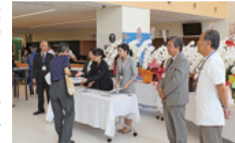
▲8月11日(木・祝)内覧会

東日本大震災を教訓に、災害時でも機能する病院として再建しました。「市民にひらかれた病院」をコンセプトに、各医療機関との連携をより強化し、本医療圏において切れ目のない医療供給が実現できる体制の構築を目指します。