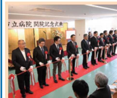
8月10日(水)開院記念式典