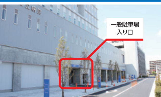
一般駐車場 入り口