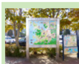
観光案内板の張り替え (平成26年度)