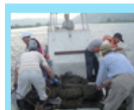
水産資源の回復に対する助成 (平成24年度～)