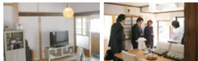
▲センターは、空き家となっていた木造2階建ての民家を活用して整備しました。新規漁業者の研修や、漁業従事者の短中期的なシェアハウス機能を持った施設です。