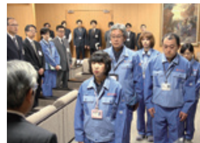
▲4月21日(木) 職員派遣出発式