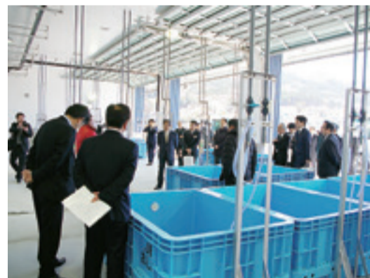
完成式典・内覧会の様子