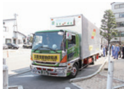
▲4月16日(土) 支援物資発送

市では、平成28年熊本地震および断続的に発生している余震により甚大な被害を受けた熊本県八代市に支援物資を送り、職員の派遣を行いました。 ※石巻市と八代市は、平成24年11月15日に災害時相互応援協定を締結しています。