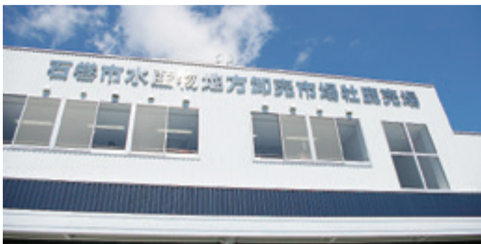
▲市場は鉄骨2階建て、延床面積1,727㎡です。