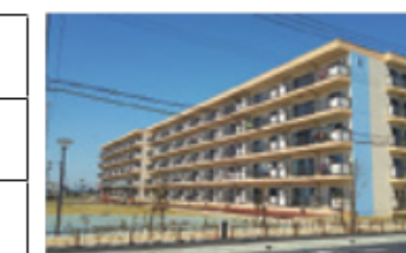
新西前沼第一復興住宅