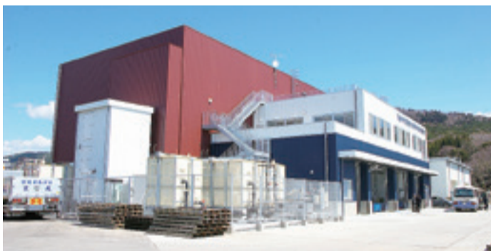
▲写真右側部分が市場、左側が製氷冷蔵庫です。震災前は別棟だった両施設を合築することにより、活魚の鮮度保持機能の向上を図っています。

▲市場1階には、荷さばき室、放射能検査室のほか、ICカードによる自動型の氷販売装置や接岸した漁船に直接砕氷を搬送する設備等を整備しました。