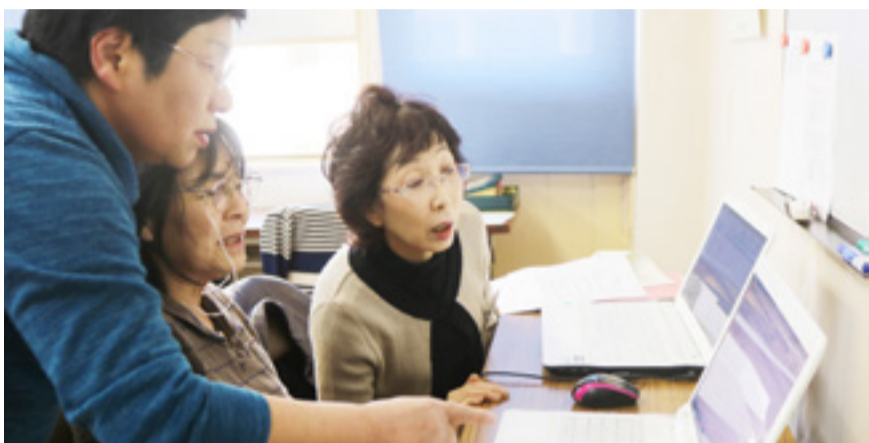
▲会員同士で教え合い、技術を高めています

の後、会員は口コミで集まり現在に至ります。サークルでは、時代に合わせたソフトウェアの操作手法や町内会の出納帳作り等の実用的な資料作成、インターネットや画像加工等、それぞれのレベルに合わせた課題に挑戦しています。また、孫の写真を家族と共有するクラウド技術でのファイル管理やタブレット端末を使った操作方法もマスターします。パソコン技術の向上を図る一