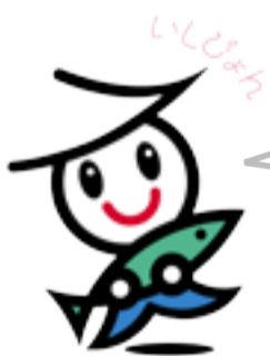
石巻市イメージキャラクター