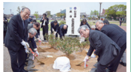
問 地域振興課(内線4243)