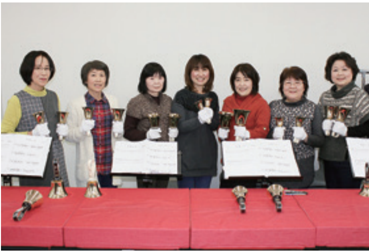
▲演奏を通じてメンバーの仲も深まります

東日本大震災の復興支援で河北文化協会に寄贈されたハンドベルを使った教室が、平成24年3月に河北総合センター「ビッグバン」で開かれました。この時の受講者の有志が集まって同年9月に河北ベルリンガーズ・アンダンテが発足しました。名前のアンダンテは「歩く速度で」を意味する音楽用語です。名前の通りゆっくりと音色を楽しみながら練習することを合言葉にしています。