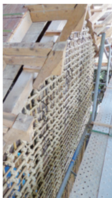
▲竹小舞の様子(修復後)

普段目にはできない貴重な伝統工法が露わになりました。また、前土蔵は棟札から天保14年(1843)に棟上されたことが分かりました。柱は腐朽部を取り除いて新材で継ぐ根継補修を行い、虫害による腐朽が見られる大梁にはエキポシ樹脂注入による補強を行う等、使える部材は可能な限り再利用をしています。