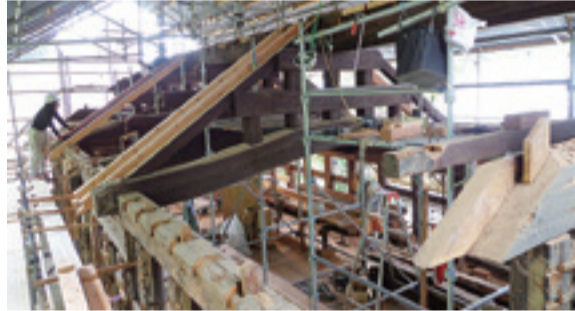
▶解体修復される土蔵

河南地区の国指定名勝齋藤氏庭園は、東日本大震災により、建物や塀等に大きな被害を受けたため、市では、国の補助のもと保存整備工事を行っています。平成25年度は茅葺屋根の葺き替えや傾いた塀等の緊急補修工事を行い、平成26年度から前土蔵および後土蔵の半解体修理を行っています。