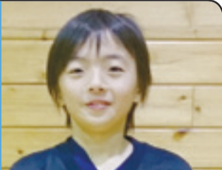
全国大会への出場が目標

を図りながら、人口減少を阻止・克服し、安全・安心な暮らしを実現するため、「石巻市まち・ひと・しごと創生総合戦略」を昨年12月に策定しました。震災からの復旧・復興事業を早急かつ着実に進めるとともに、少子高齢化や人口減少等の課題の解決に向けて全力で取り組んでまいります。本年は、昨年に引き続き、復興公営住宅への入居や防災集団移転事業での宅地引き渡しが進む予定であり、また、市立病院の開院と夜間急患センターの開設も予定されており、生活基盤の復旧・復興とともに、医療体制についても整備が進むこととなります。本年は新たに「復興・創生期間」がスタートする節目の年となります。市民の皆さまをはじめとする、全国そして世界中の皆さまからのご協力・ご支援により、復旧・復興は新たなステージへと展開していきます。今後も強い決意をもって復旧・復興を成し遂げ、まち・ひと・しごと創生に向けて取り組み所存です。新たな年を迎え、ふるさと石巻の再生・発展に向けて全力を尽くしてまいりますので、市民の皆さまのご協力をお願いいたしますとともに、ご多幸をお祈り申し上げます。新年のごあいさつとさせていただきます。