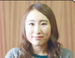
スキルアップを目指して

昨年一番の思い出は花山合宿で友達と一緒にカレー作りや沢遊びをしたことです。学校では好きな理科や図工、体育の授業を頑張りました。1年生から所属しているミニバスケットボールチームの河南ディアーズで練習も一生懸命やりました。今年は、もっとバスケットを練習したいです。シュートをたくさん決めて、全国大会に出場したいです。今年は6年生になるので低学年の面倒を積極的に見ていきたいと思っています。