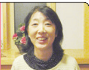
地域と家族の絆を大切に

「猿に絵馬」 取り合わせのよいものたえ。昔は猿を馬小屋の守護とする信仰があり、農家では「申」と書かれた紙を馬小屋に貼っていた。また、正月や祭りでは猿が馬をひくところの描かれた絵馬や神札が用いられた。