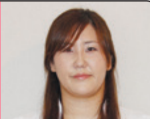
子育ても仕事も充実を

昨年の思い出は所属するミニバスケットボールチームが下級生交流大会で3位に入賞したことです。頑張って練習したことで、優秀選手賞をもらうこともできました。学校の授業では、図工の時間に校庭の桜の絵を上手に描きました。今年はバスケットでシュートを確実に決められるように練習したいと思います。また、鼓笛隊では希望していたトランペットを演奏することになり、川開き祭りに向けてしっかり練習したいです。