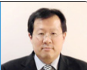
復興と安寧の一年に期待

美容関係の仕事に就いて15年が経ちました。その間に3人の子どもにも恵まれて忙しい日々を過ごしています。昨年は本当にあっという間に過ぎた1年でした。今年はずっと家族と過ごす時間を増やして、旅行等に行きたいと思っています。それに加えて仕事にも一段と力を入れていきたいです。子どもがいても、定年を迎えても、輝く女性たちが地域に増えるように応援していくことが今年の目標です。