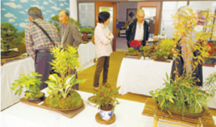
▲展示会には山野草が並び、毎回多くの来場者を楽しませてくれます

(64)は、趣味だった盆栽いじりから始まり、地域の魅力を感じる山野草の世界へ飛び込みました。「夏の暑さや冬の寒さを乗り切るために草花を管理していくのが難しく、まだまだ勉強が必要だ」と向上心あふれます。