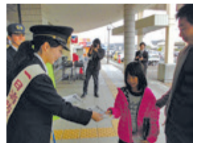
▲大型物販店での街頭広報活動