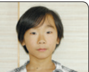
川開きでの演奏楽しみ

おしかのれん街で寿司店を営んでいます。まだまだ復興途上の牡鹿地区は人口減少等もあって先の見えない状況ですが、家族や地域で団結して乗り切りたいです。住宅が徐々に建ち始める今年は、ようやくスタートラインについたと感じます。一歩ずつ着実に復興へ向かい、観光のまちである鮎川を復活させていきたいです。また、趣味のグラウンドゴルフも続けて、地域の皆さんと交流しながら楽しみたいです。