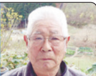
ひ孫の健やかな成長願う

地元の小室地区で定置網の網おこしやワカメの袋詰め等、海に関わる仕事に30年以上携わってきました。自宅が震災で被災したため高台移転となり、住む場所は変わりましたが、家族や地域の人たちと一緒に以前と変わらず楽しく過ごしています。今年は仕事を続けながら、獅子舞等の地域のイベントで親睦を深めていくとともに、孫が野球のスポーツ少年団に所属しているので、試合の観戦も楽しみにしています。