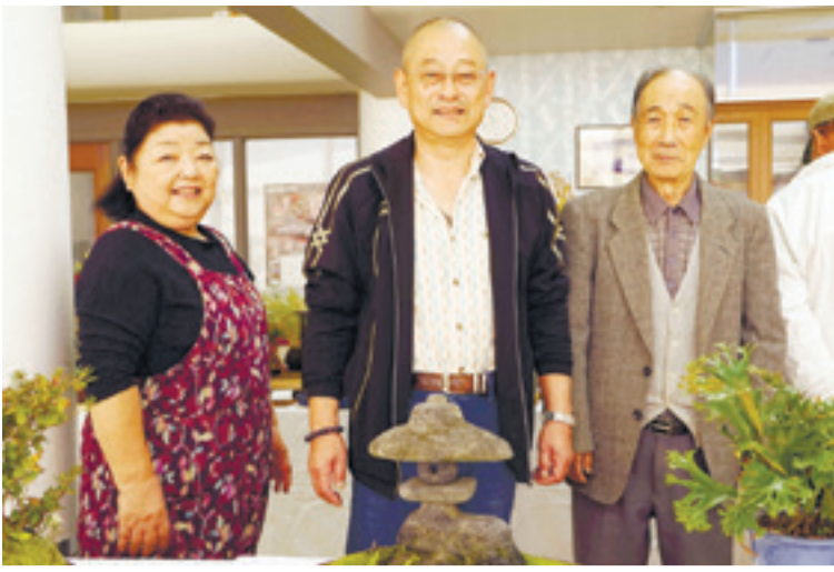
▲北上文化協会山野草愛好会の皆さん