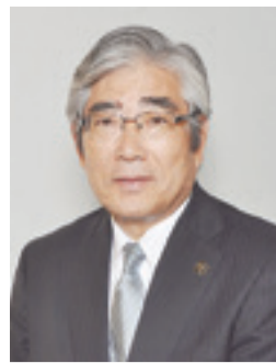
石巻市長 亀山 紘