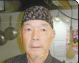
復興へ向かって一歩ずつ

昨年は健康にも恵まれ、更には一昨年誕生したひ孫も1歳を迎え喜びと活気に満ちた1年でした。趣味で始めた竹細工は、波板地域交流センターで展示、販売され、日常では妻と共に畑仕事や海・山の幸を収穫したりと、雄勝の四季折々を感じながら日々楽しく張り合いのある生活を送ることができました。ますますかわいくなるひ孫の成長を楽しみに、今年も健康で昨年同様充実した日々を送られたらと願っています。